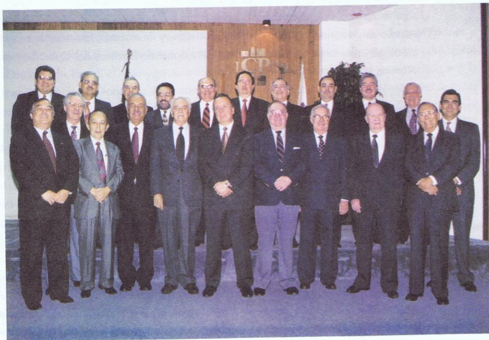
Ex-Presidentes del Instituto de Contadores Públicos de Nuevo León

En mi carácter de Presidente del Consejo Directivo, celebré diversas juntas con los señores ex-Presidentes de nuestro Instituto, de quienes recibí, además de su apoyo a nuestra gestión, diversas sugerencias que coadyuvaron y nos orientaron en la toma de decisiones.